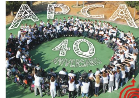
16/02/2017 CELEBRACIÓN 40 ANIVERSARIO DE APCA

Ofrecen servicios de atención directa a 400 personas, con más de 300 profesionales trabajando en los distintos centros. Todos los servicios y programas que se realizan se basan en criterios de calidad, con el fin de proporcionar a las personas con parálisis cerebral la atención que precisan para alcanzar los máximos niveles de desarrollo personal. Siendo esta atención entendida de manera integral .